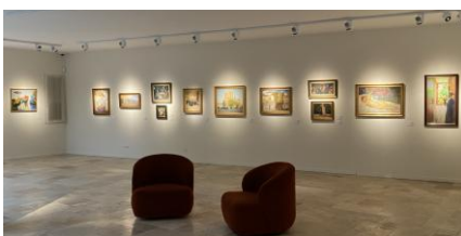
Museum of L'esquisse