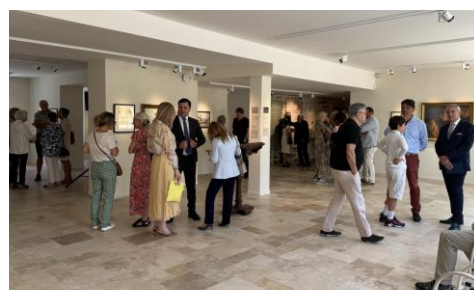
Museum of L'esquisse