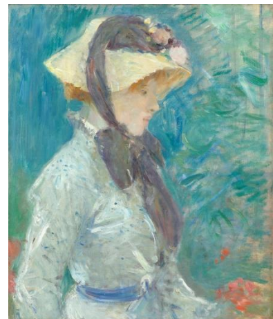
Berthe Morisot. Jeune femme avec un chapeau de paille.