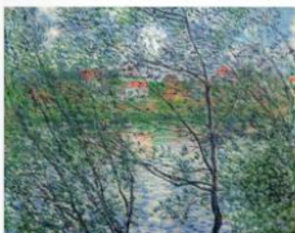
Île de la Grande Jatte, Claude Monet.

Retour sur l'histoire. « Ils sont mondialement connus mais songez qu'à cette époque on leur refusait les salons, ils étaient bannis. Parmi eux, une femme, Berthe Morisot, fut même refusée aux Beaux-Arts ! » Ces jeunes artistes se rabattaient sur les ateliers privés où l'on peut s'épanouir avec moins de contraintes et plus de liberté. « Ils créent leur propre exposition en 1874, chez leur ami photographe, Nadar, à Paris, boulevard des Capucines. » Et le passionné de me montrer sur son téléphone l'endroit actuel, au numéro 35, près de