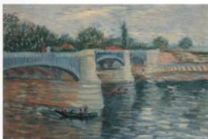
La Seine avec le Pont de la Grande Jatte. Vincent Van Gogh (1853-1890). Huile sur toile. Musée Van Gogh - Amsterdam

Retour sur l'histoire. « Ils sont mondialement connus mais songez qu'à cette époque on leur refusait les salons, ils étaient bannis. Parmi eux, une femme, Berthe Morisot, fut même refusée aux Beaux-Arts ! » Ces jeunes artistes se rabattaient sur les ateliers privés où l'on peut s'épanouir avec moins de contraintes et plus de liberté. « Ils créent leur propre exposition en 1874, chez leur ami photographe, Nadar, à Paris, boulevard des Capucines. » Et le passionné de me montrer sur son téléphone l'endroit actuel, au numéro 35, près de