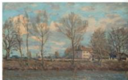
L'Île de la Grande Jatte. Huile sur toile - 1873. Alfred Sisley (1839-1899). Musée d'Orsay - Paris.

Et de préciser qu'un parcours a été mis en place par le conseil départemental en 2009 à chacun des lieux où les peintres ont posé leur chevalier, avec à chaque fois un panneau d'information. Le téléphone sonne, le spécialiste de l'impressionnisme est très sollicité. Car la grande actualité, c'est la sortie d'une édition spé-