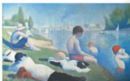
Baignade à Asnières. Georges Seurat. Huile sur toile - 1884. The National Gallery - Londres

la Slovaquie et les Pays-Bas. Six routes thématiques proposent de suivre le pas d'un artiste ou d'un groupe de peintres afin de mieux appréhender l'effervescence européenne liée à ce mouvement pictural.