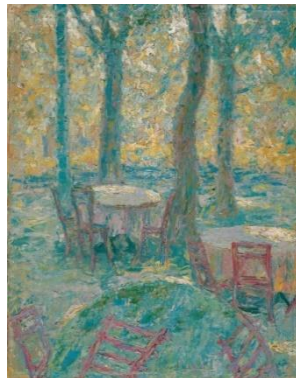
Ivan Grohar. Le Jardin de Stermaje. 1907 National Gallery, Ljubljana