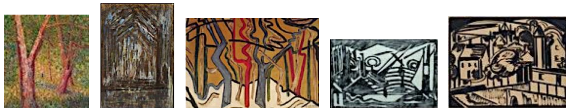
Jacoba van Heemskerck, Forest in Summer , 1909; Forest/Tree Vault , 1913; Bild [Trees in the snow] , 1915; Composition , 1915; Drawing [Town] , ca. 1915. [Zeeuws Museum Middelburg; ICEAC CFVV Domburg; MTVP Museum Domburg]