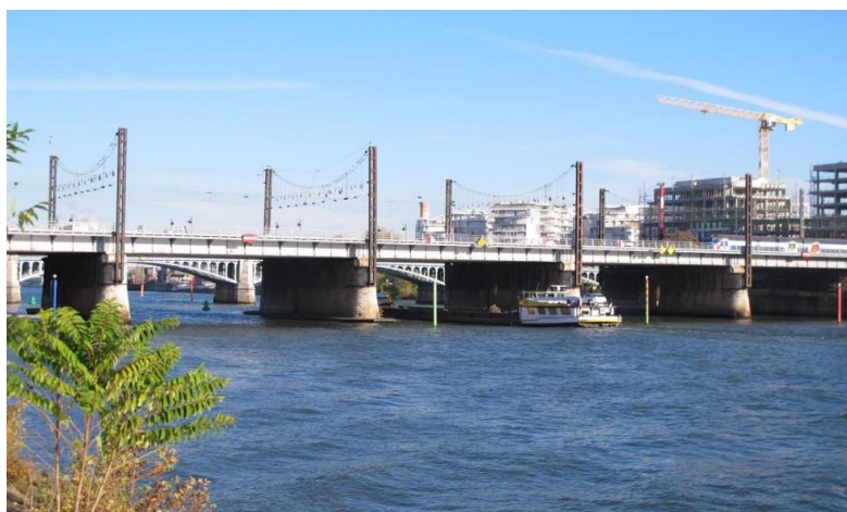
Le pont d'Asnières de nos jours.

La mairie d'Asnières a en effet signé, lundi, une charte pour intégrer le réseau de la route des impressionnistes. Le parcours Paul-Signac courra des Hauts-de-Seine jusqu'à Saint-Tropez (Var) en passant par Saint-Malo (Ille-et-Vilaine), Les Sables d'Olonne (Vendée) ou encore Antibes (Alpes-Maritimes).