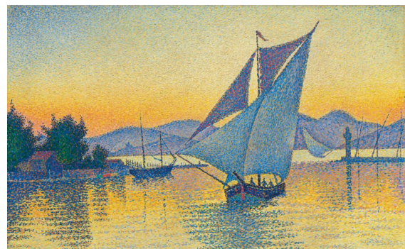
Le Port au soleil couchant (Saint-Tropez), 1892.