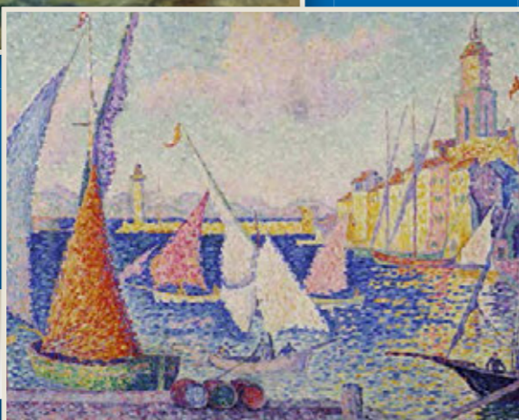
Saint-Tropez, le Quai Paul Signac (1863-1935). 1899 Huile sur Toile. 35 x 51,7 cm. Musée de l'Annonciade, Saint-Tropez