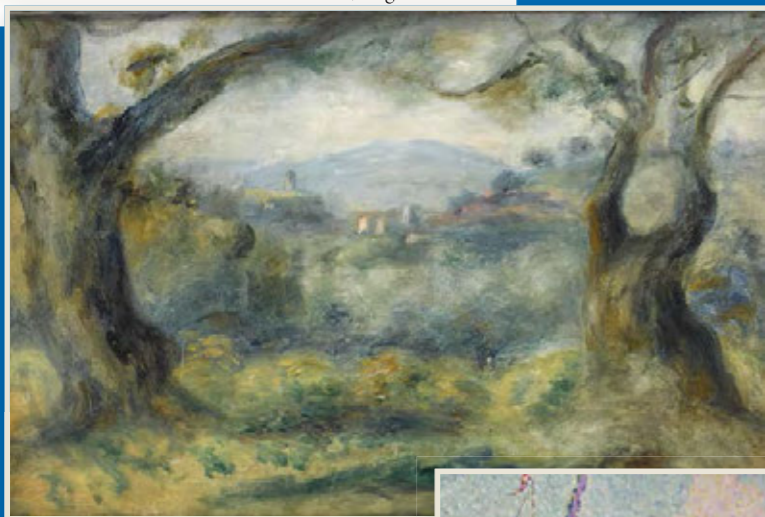
Paysage aux Collettes, Pierre-Auguste Renoir (1841-1919). Huile sur toile. 35 x 22 cm. Musée Renoir, Cagnes-sur-Mer